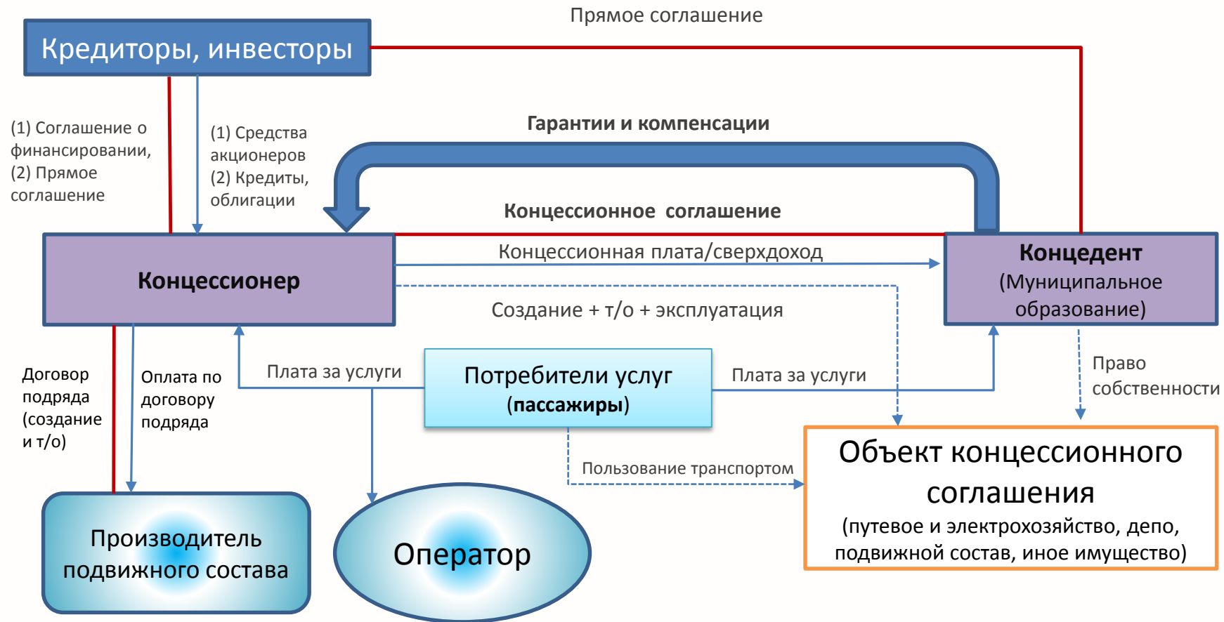
Схема концессионного трамвайного проекта