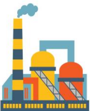
Производители и импортеры

Сведения о смене владельца товара и его количестве даст детальную картину по товарным потокам