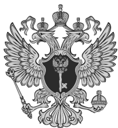
Управление делами президента