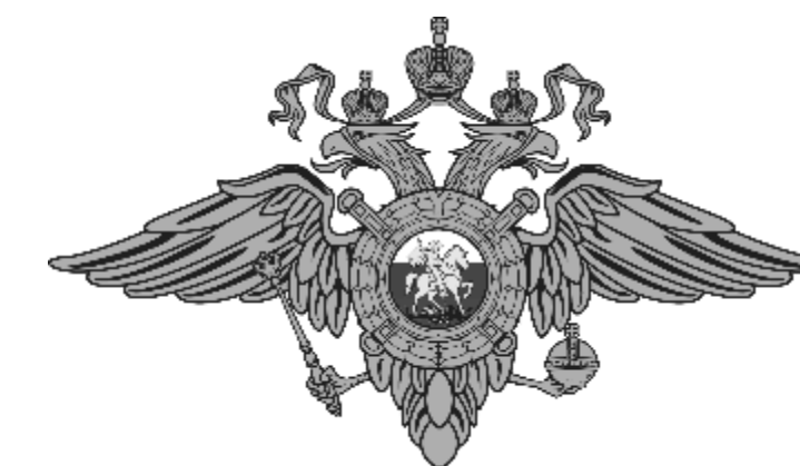
Министерство Внутренних дел