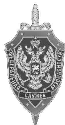
Федеральная служба безопасности