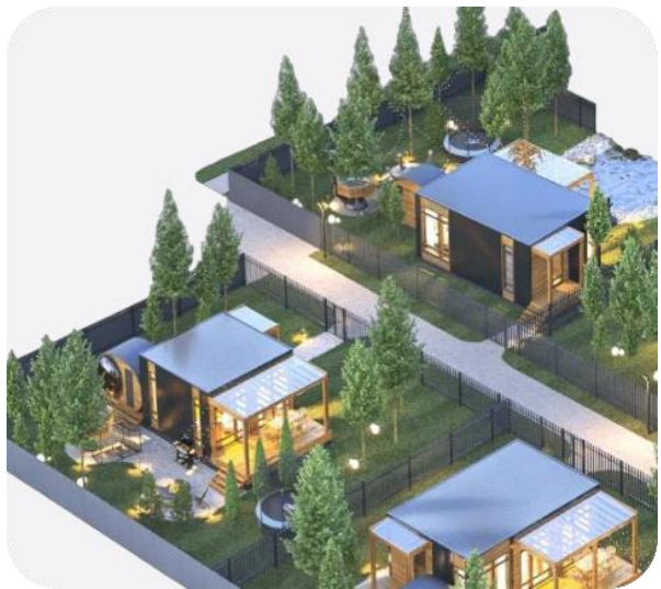
Отдельно стоящие коттеджи