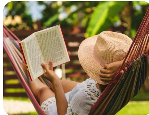
Велнес/ антистресс / детокс