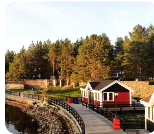
Глэмпинги / базы отдыха