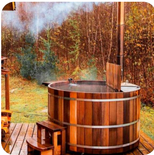
Дома с фишками Сауны / купели / камины